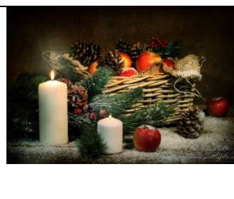
А) Новый год